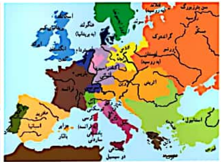
اروپا در ۱۸۵۰

تفاوت های عمده نقشه اروپا از ۱۸۵۰ به ۱۹۱۴: